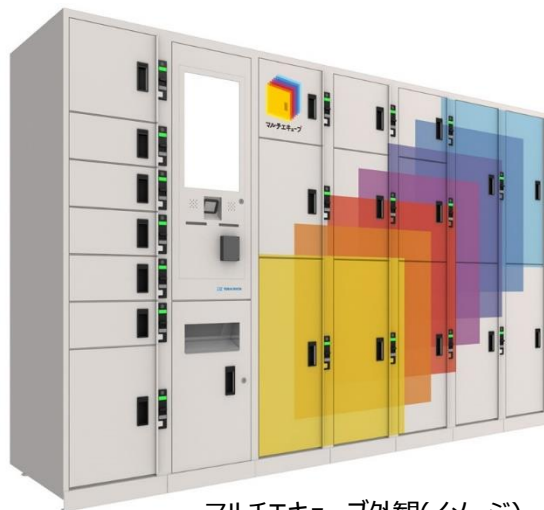
マルチキューブ外観(イメージ)

2025年2月28日現在、東京駅や新宿駅などに計460台を設置しています。2026年度内に首都圏駅構内を中心に、約1,000台を展開予定です。